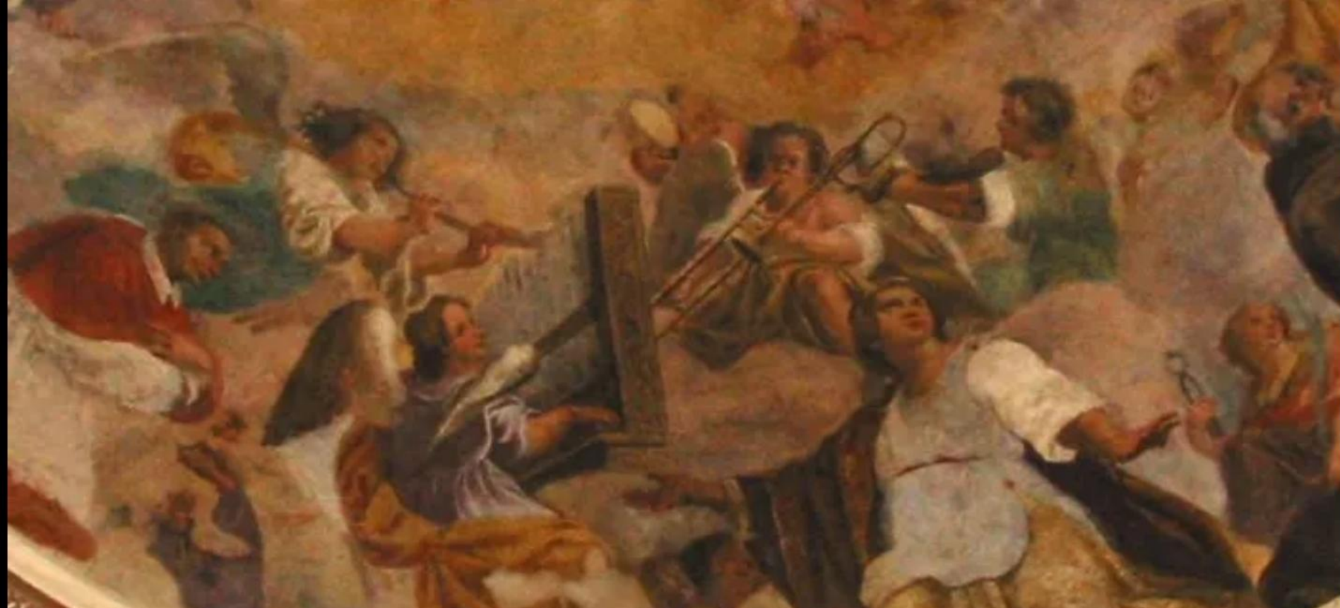
16 век — Вероли, Италия: Фреска на потолке базилики Санта-Мария-Саломея изображает ангела-тромбониста, выступающего “корнетто” и органом